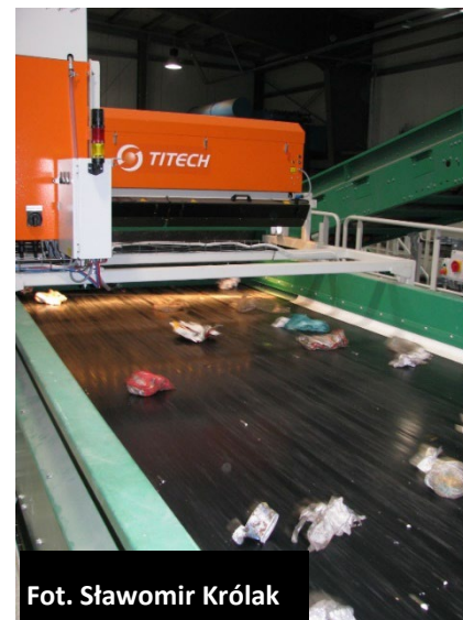
Fot. Sławomir Królak